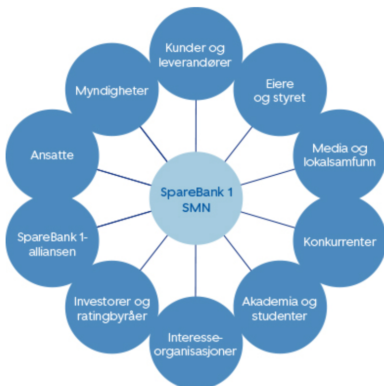
Figur 3: Oversikt over interessentene til SpareBank 1 SMN

Vi gjennomfører en kontinuerlig interessentdialog med et stadig større nettverk av interessenter. Dette er et ledd i arbeidet med å sikre at vi har en helhetlig og langsiktig tilnærming til hvordan vi skal skape verdi for eiere av egenkapitalbevis, kunder, ansatte og samfunnet. En oppsummering av de mest vesentlige interessentene vises nedenfor. Mer informasjon finnes i dokumentet Interessentdialog i bærekraftsbiblioteket på smn.no/barekraft .