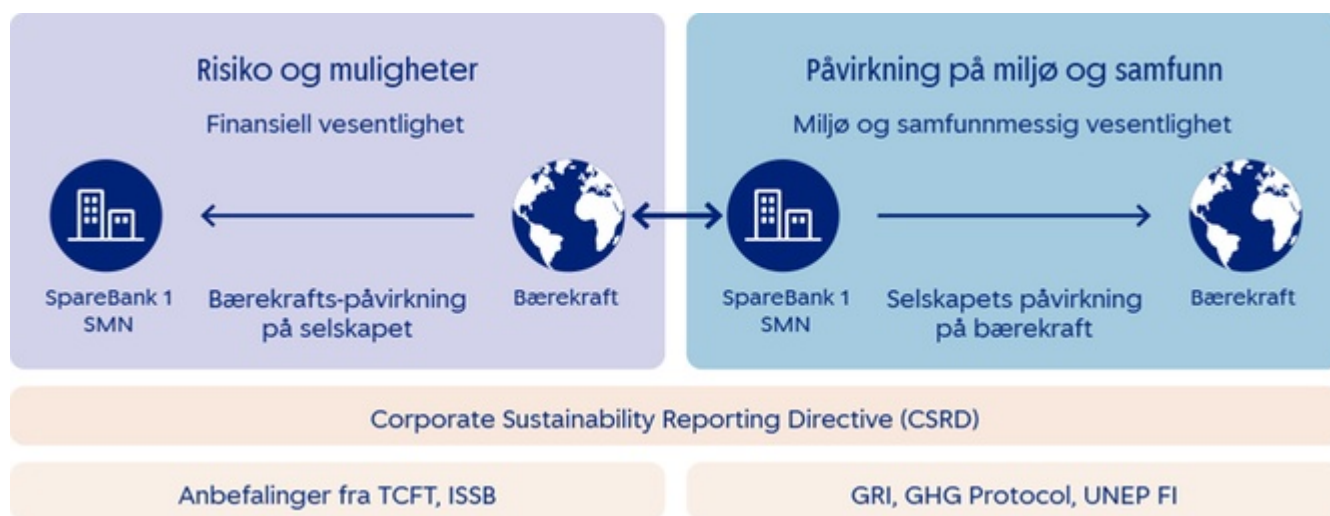
Figur 4: Dobbelt-vesentlighetsanalyse

*Les mer om klimarelaterte risikoer og muligheter i «Sikre langsiktig lønnsomhet og konkurransekraft».